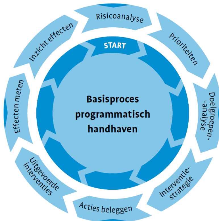
Figuur 1: toezichts- en handhavingscyclus

De methode programmatisch toezien en handhaven is de basis van het uitvoeringsprogramma om de beschikbare capaciteit zo effectief mogelijk in te zetten en de naleving van regelgeving te verbeteren. Daarmee is het ook een middel om onze doelstelling voor de provinciale omgeving te bevorderen. In onderstaand model is de methodiek weergegeven. Feitelijk is dit de onderkant van de "big-eight" van de cyclus beleid en uitvoering.